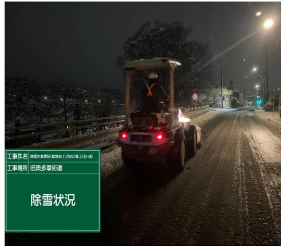
羽村市内 旧奥多摩街道