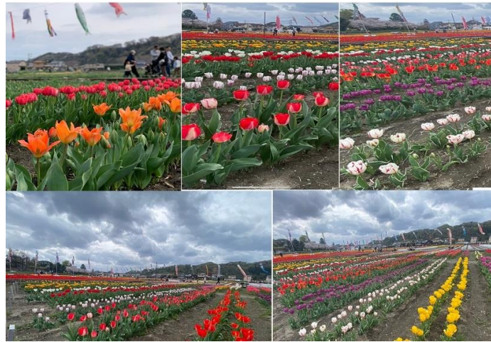
2024年のようす(羽村市内)

4月は、桜やチューリップなど花が咲き誇る時期となります。西多摩管内でも花の見どころがありますのでご紹介いたします。羽村市内は、はむら花と水のまつり2024が開催されました(4月15日にて終了)