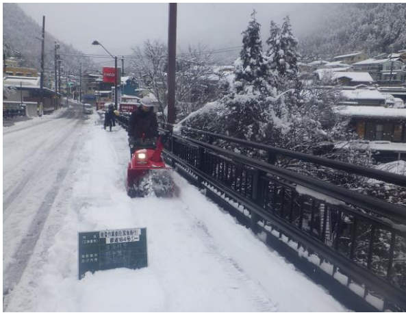
奥多摩町氷川 昭和橋

奥多摩町は山間部を要する東京都内でも積雪量が多い、場所となります。毎年度の積雪の機会があり、除雪作業に出動しています。写真は、令和6年2月に振った積雪時の作業の様子です