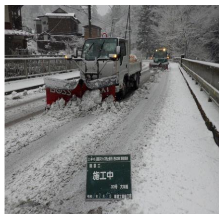
檜原村内 檜原街道