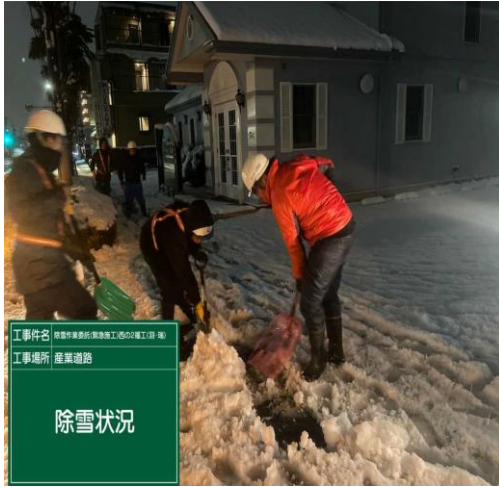
羽村市内 西多摩産業道路

青梅・羽村地区 青梅市内は山間部と人口がおりま、青梅駅、河辺駅方面を要する場所となります。また、羽村市内は起伏のある地形の道路をなどの除雪の様子を紹介いたします。羽村市内の夜間、機械使用の除雪、歩道部の人力による除雪と塩化カルシウム散布の様子です。