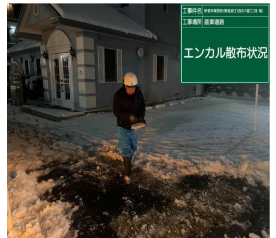
羽村市内 西多摩産業道路

あきる野地区 あきる野地区は平野部のある、あきる野市内と山間の日の出町、檜原村があります。標高の高い奥多摩周遊道路、檜原村内の除雪の様子です