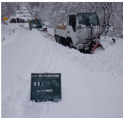
檜原村内 奥多摩周遊道路

あきる野地区 あきる野地区は平野部のある、あきる野市内と山間の日の出町、檜原村があります。標高の高い奥多摩周遊道路、檜原村内の除雪の様子です